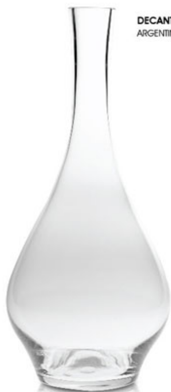
DECANTER SF ALTO $ 320.- ARGENTINA. STOCK 27 u.