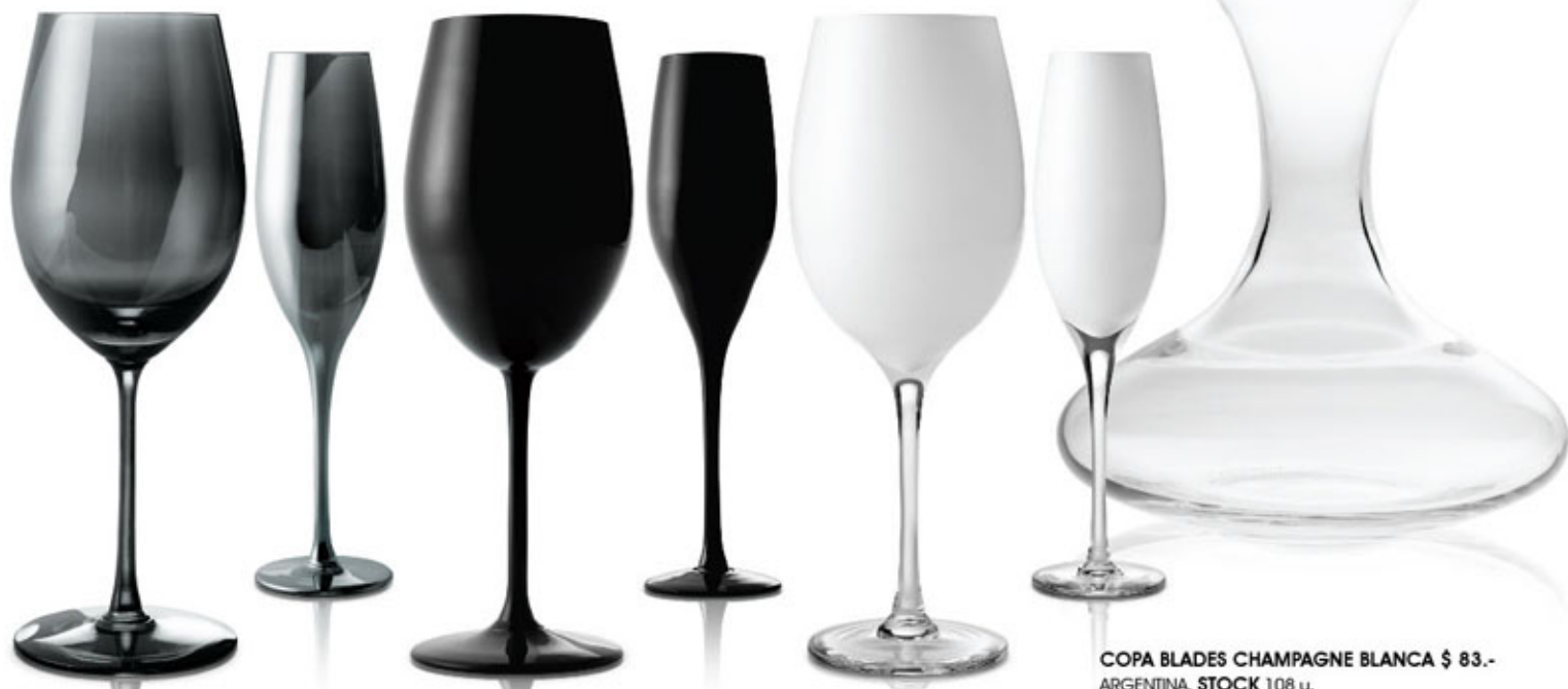
COPA BLADES CHAMPAGNE BLANCA $ 83.- ARGENTINA. STOCK 108 u.