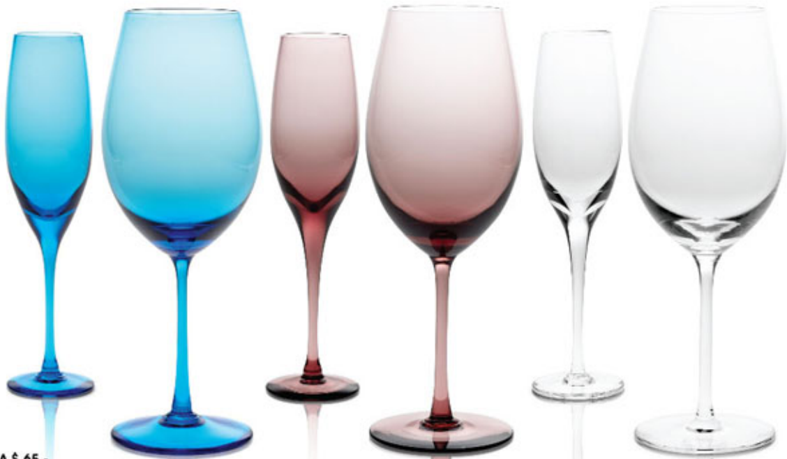
COPA BLADES CHAMPAGNE $ 50.- ARGENTINA. STOCK 108 u.