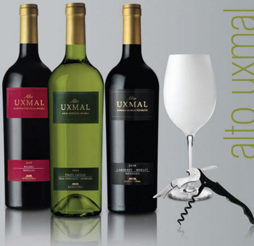
ALTO UXMAL x 750 Cc. MENDOZA, ARGENTINA. $ 47.- STOCK (MALBEC) 360 u. STOCK (PINOT GRIGIO) 360 u. STOCK (CABERNET-MERLOT) 360 u.