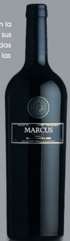
MARCUS GRAN RESERVA MALBEC x 750 Cc. PATAGONIA, ARG. STOCK 60 u. $ 198.-